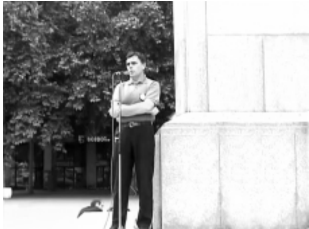
„Ми смо у њраву“ – 2005.