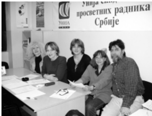
Руководство Форума београдских гимназија

Током јуна, јула, августа и септембра 2004. професори београдских гимназија завршавају основни курс из рачунарства који организује Министарство просвете, а Форум врши логистику. Такође, професори рачунарства похађали су специјалистичке курсеве.