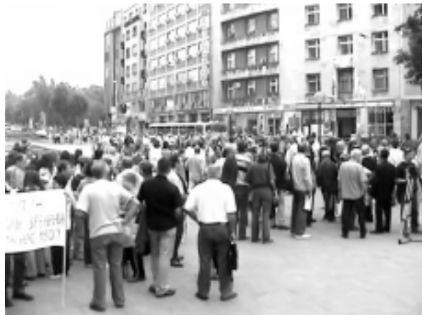
Трг Николе Пашића 2005.