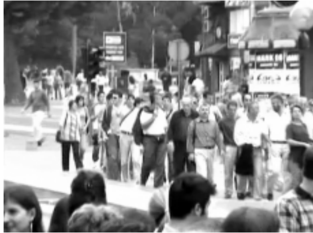
Пројекциј у Београду 2005.

Од почетка свог министровања Вуксановић се бави искључиво личним маркетингом и употребом јавности. У својој мисији обмањивања јавности, осим што је тврдио да неће бити отказа у просвети, он је упорно понављао да је испунио све штрајкачке захтеве УСПРС, да би упоредо с тим отпочео репресију према УСПРС каква се не памти још од времена Слободана Милошевића. Унија је све то издржала, а ево, уме и да узврати.