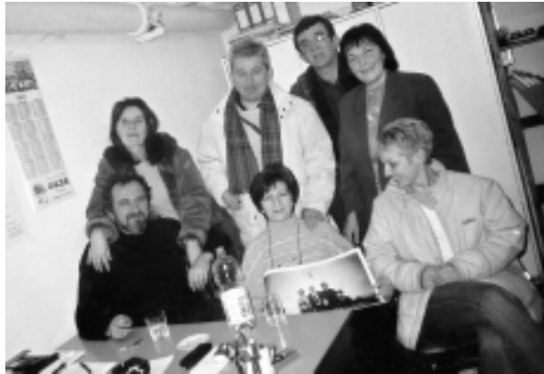
Руководство СОЧ-а из 2003.

Пошто смо текст почели анегдотом, њоме га и завршавамо. Кажу, када се неко од чланова СОЧ-а појави у медијима било којим несиндикалним поводом, већ сутрадан је кључно питање у Чачку — када СОЧ почиње штрајк.