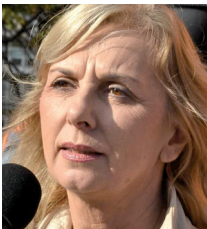
Пише: Јасна Јанковић

Како смо васпитаче, учитеље и професоре довели у ситуацију да се више не боје само за егзистенцију, већ за голи живот. Професорка је преживела озбиљну трауму. Њен улазак у одељење више никада неће бити исти. Остаје јој тужба против изгредника, ако се одлучи, о сопственом трошку, наравно и остајемо јој ми